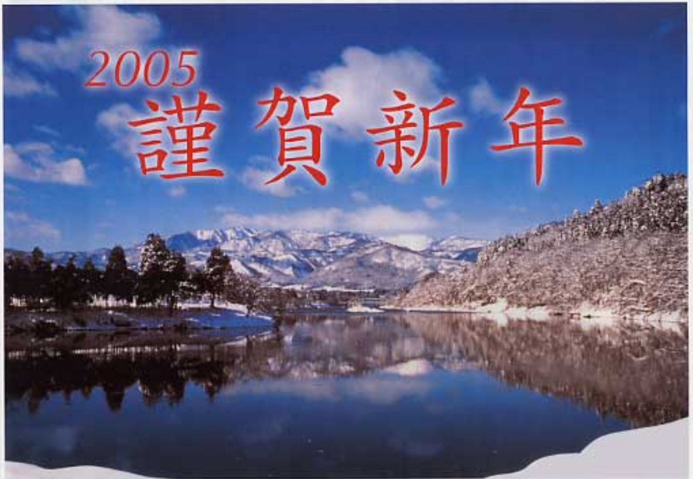
大淀から葉山を望む